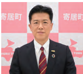
埼玉県 寄居町 町長 峯岸 克明

第94回都市対抗野球大会出場、誠におめでとうございます。7年連続37回目の出場を心からお祝い申し上げます。