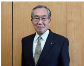
埼玉県大里郡寄居町 町長 花輪 利一郎

第93回都市対抗野球大会への出場、誠におめでとうございます。寄居町・小川町代表となって初めてとなる記念の年に、6年連続36回目の出場を、町民とともに心からお祝い申し上げます。