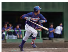
峯村は新人だが攻守の柱を担う