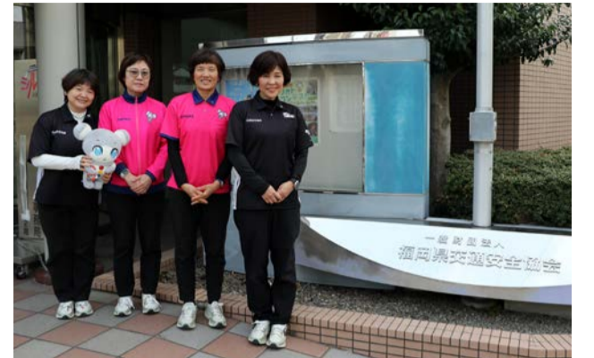
(一財)福岡県交通安全協会 交通安全教育班の皆さん

※2 自転車第1当事者または第2当事者になる事故。第1当事者は交通事故の当事者のうち、過失が最も重い者または過失が同程度の場合は被害が最も軽い者。第2当事者は過失がより軽い者、過失が同程度の場合は被害がより大きいほうの当事者。