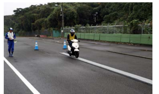
競技会では一人ひとりのパイロンスラロームや一本橋(写真)のタイムを計測