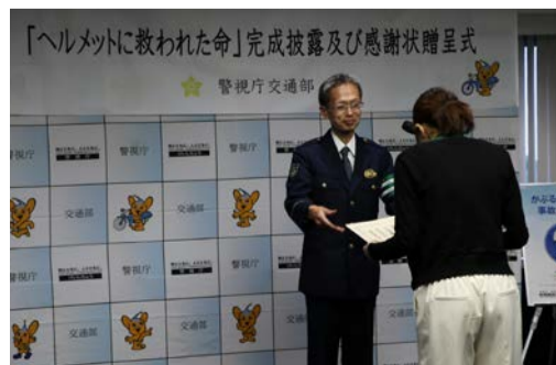
Aさんには警視庁から感謝状を贈呈された