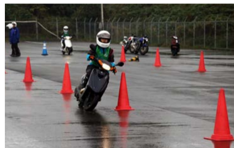
パイロンスラロームでは車体を安全にコントロールするための技術を高める