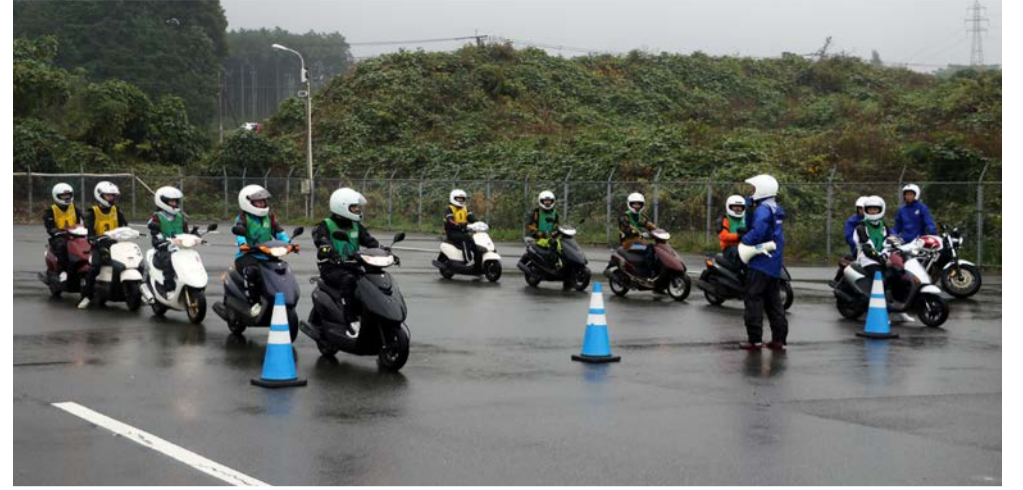
二輪車競技部の生徒たちはレインボー熊本の広いコースで日頃できない課題に取り組んだ

今回の特別講習には二輪車競技部の生徒11名が参加。午前中はブレーキングやパイロンスラロームといった課題に取り組んだ。ブレーキングは直線コースを30~40km/hで走行し、前輪のみ、後輪のみ、前後輪で急制動を行う。前輪・後輪ブレーキの特性と、それぞれで停止距離の違いを生徒たちは確認した。パイロンスラロームでは、直線上に5m間隔で配置されたパイロンを左右に避けながら通過する練習を繰り返し、効果的なアクセルとブレーキの操作を身につけた。途中でインストラクターは生徒たちを集め、「パイロンの裏側を通る走行ラインを意識すると、よりスムーズに走れるようになります。練習の中では、