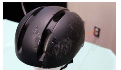
Aさんが実際に着用していたヘルメット

ヘルメットを着用するようになったきっかけを母親からの再三にわたる呼びかけだったと語っている。最初は受け流していたが、何度もいわれるうちに着用する気持ちになったようだ。完成披露式の後、警視庁から感謝状を贈呈されたAさんは「走ってきたクルマのフロントガラスに頭を強くぶつけて空中に飛ばされた瞬間、『これで私は死んじゃうのかな』という気持ちがよぎったことを今でも記憶しています。ヘルメットをかぶっていなかったら、このように皆さんにヘルメットの大切さをお伝え