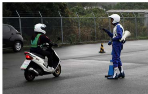
インストラクターが練習の様子を見ながら生徒一人ひとりにアドバイス