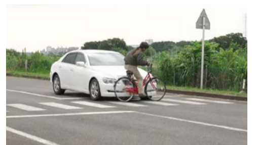
クルマと衝突した時の状況を再現