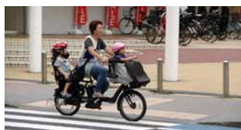
ヘルメットはかぶせているが、シートベルトを着用させていない保護者