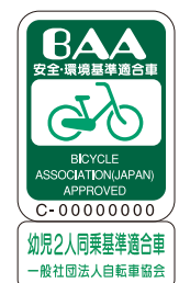
「BAAマーク」と「幼児2人同乗基準適合車マーク」