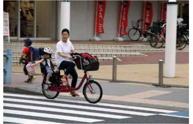
子どもにヘルメットとシートベルトを着用させている保護者

※医療機関ネットワーク事業=参画する医療機関(平成30年3月時点で24機関)から事故情報を収集し、再発防止に活かすことを目的とした、消費者庁と独立行政法人国民生活センターとの共同事業。