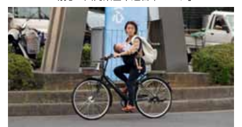
子どもを抱っこしながら運転している保護者。観察を実施した東京都では幼児は背負って運転しなければならない(幼児用座席に2人乗車させている場合を除く)