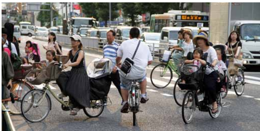
子どもにヘルメットとシートベルトを着用させないで、自転車を運転する保護者が多く見られた

ていたのは19人と12%にとどまった(右表参照)。ヘルメットがあるにもかかわらず着用していない子どももいた。また、おんぶ(抱っこ含む)されていた子どもは25人で、全員がヘルメットを着用していなかった。観察場所近くのスーパーの駐輪場では、嫌がる子どもをなだめながらヘルメットを着用したりして、出発まで10分以上かかっているケースも見られた。一方で、ヘルメット・シートベルトを着用していない場合、子どもの乗降時間は短い傾向にあった。