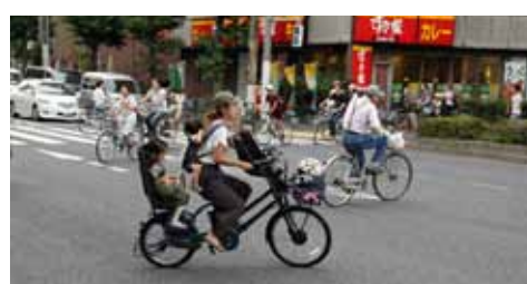
ヘルメットをカゴに入れたままで、子どもにかぶせていない保護者もいた