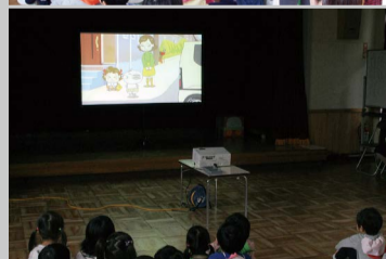
園外に出て歩き方の練習をする前に「できるニャンと交通安全を学ぶ」を使って、子どもたちに問いかけながら「止まる」「待つ」の重要性を理解してもらう