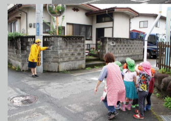
様々な交差点で「ストップの約束」を実践して横断