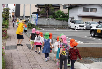
駐車場の近くではクルマの出入りにも注意してもらう