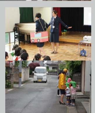
狭い道路でクルマが来たら、通り過ぎるまで身体を横向きにして待つように指導