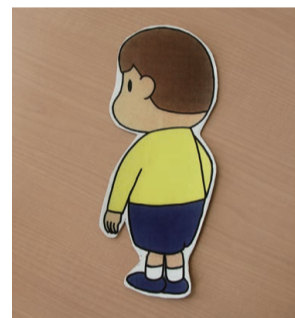
「止まる」ということを子どもたちに意識づけるため、独自でイラストを用意