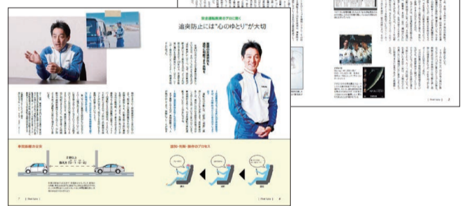
四輪販売会社で配布している安全情報誌「Think Safety」。以下のホームページからダウンロードすることも可能。 http://www.honda.co.jp/safetyinfo/topics/safety_campaign/