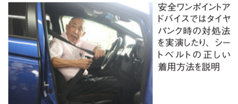
安全ワンポイントアドバイスではタイヤパンク時の対処法を実演したり、シートベルトの正しい着用方法を説明

※あやとりい＝Honda が三重県鈴鹿市と協力して開発した交通安全教育プログラム。幼児～小学校低学年対象の「あやとりいひよこ編」、小学3～4年生対象の「あやとりい」、幼児～小学校高学年対象の「あやとりい 自転車教室」、高齢の歩行者・自転車利用者対象の「あやとりい 長寿編」がある。「あやとりい」は「あんぜんを やさしく ときあかしりかいていただく」の略。詳細は以下ホームページを参照。 http://www.honda.co.jp/safetyinfo/kyt/ayatorii/