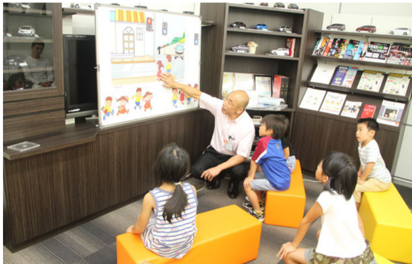
「あやとりい」を使ったお子様向けの交通安全教室

Honda の四輪販売会社では、啓発冊子や映像を活用しての全席シートベルト着用の声かけに取り組んでいる。また、店頭、近隣地域の保育園・幼稚園にて、「あやとりいひよこ編」を活用した交通安全教室を開催している四輪販売会社もある。一方、二輪販売会社ではお客様に安全なツーリングを啓発するためのパンフレットの配布を行っている。