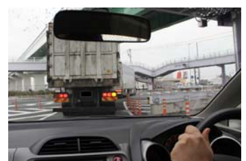
Aに向かう右折レーンを走行する車内から。大型トラックが先行していると、対向車線の様子は目視しづらい