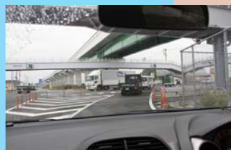
浜松方面から右折レーンを走行する。停止線まで距離が長い