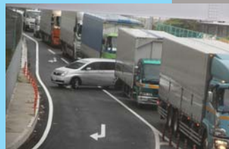
道路沿いのコンビニ駐車場から出る車両は車列を横切って合流する