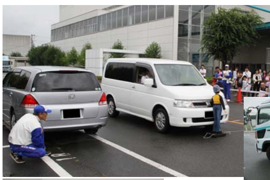
座学では狭山市交通指導員が「あやとりひよこ編」を使って、交通行動の基本を伝えた

この親子交通安全教室は、子どもには事故の危険や怖さ、保護者には自らが事故を防ぐ知識と、子どもの行動特性を理解していただくことを目的としている。