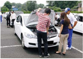
トレーニングに入る前に運行前点検のポイントを確認する

「トレーニング中、新入社員一人ひとりの運転の特徴をインストラクターの方々にチェックしてもらっています。」