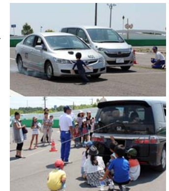
鈴鹿地区親子交通安全教室でも飛び出し事故の再現(上)や、クルマの死角の範囲の確認(下)が行われた

この親子交通安全教室は、子どもには事故の危険や怖さ、保護者には自らが事故を防ぐ知識と、子どもの行動特性を理解していただくことを目的としている。