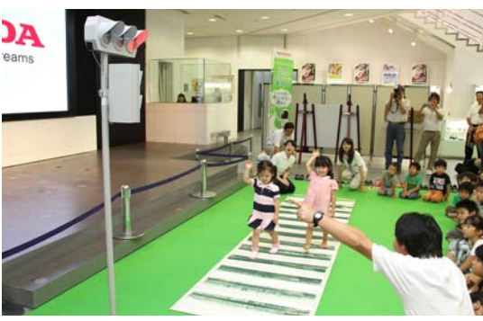
模擬の横断歩道で道路を渡る時の3つの約束を実践する子どもたち

「あやとりひよこ編」を活用した交通安全指導が行われた。インストラクターが道路を歩く時の位置や、信号機の意味など基本的な交通ルールを説明。