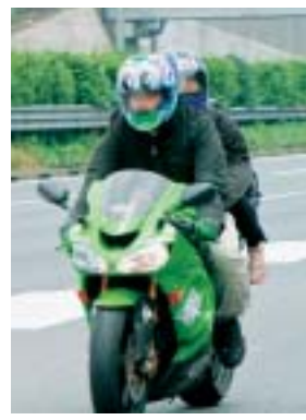
素足にサンダルを履いたパッセンジャー

WATCHING パッセンジャーの服装に軽装が目立つ 観察は「東名高速道路・海老名SA」と「中央高速道路・談合坂SA」の2カ所でサービシアリア付近の本線を走行している二人乗りの二輪車、およびサービシアリアに進入して二人乗りの二輪車を観察した。 午前8時から正午までの4時間に、海