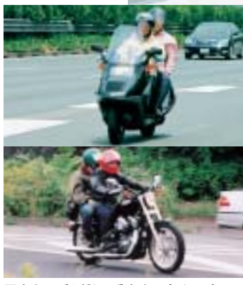
写真上 / 手を離して乗車するパッセンジャー 写真下 / 正しい乗車姿勢のパッセンジャー

観察場所 / 東名高速道路下り線「海老名サービスエリア」付近 中央高速道路下り線「談合坂サービスエリア」付近 観察日 / 6月5日(日曜日) 天候 / くもり 観察時間 / 8:00 ~ 12:00 (4時間) 観察者 / 4名