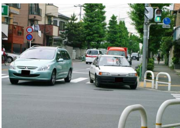
ウィンカーを出さずに左折するクルマ

「あらかじめその前からできる限り道路の左側端に寄る」、右折する時は「あらかじめその前からできる限り道路の中央に寄る」ということだ。