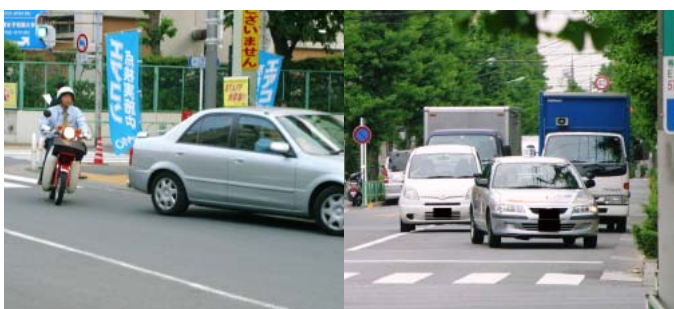
(写真左) 突然ガソリンスタンドに入ろうとしたクルマを避けるバイク (写真右) 教習車は左折の時、きちんと道路の左側端に寄っていた

観察の結果、右折時にあらかじめ道路の中央に車両を寄せてから右折した車両は、58台(四輪車54台・二輪車4台)中52台(四輪車49台・二輪車3台)で、9割近くがルールを守っていた。