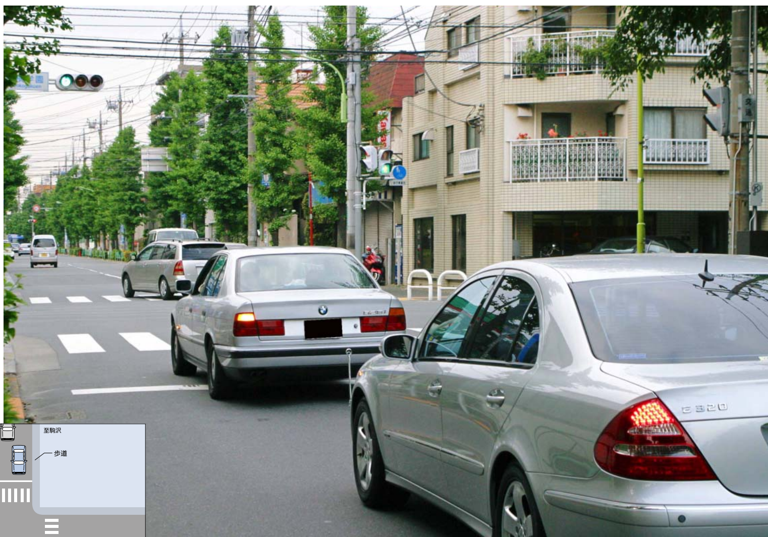
道路の左側端に寄せずに左折するクルマ

観察場所 / 東京都世田谷区等々力7丁目10付近 観察日 / 5月12日(水曜日) 天候 / 曇り 観察時間 / 16:15 ~ 17:45(90分) 観察者 / 4名