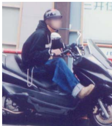
グローブ非着用のライダー

ほぼすべてのライダーが着用していた。ただし、グローブに関しては89名中25名(28・1%)しか着用していなかった。同乗のパッセンジャーでは、10人全員がグローブを着用していなかった。