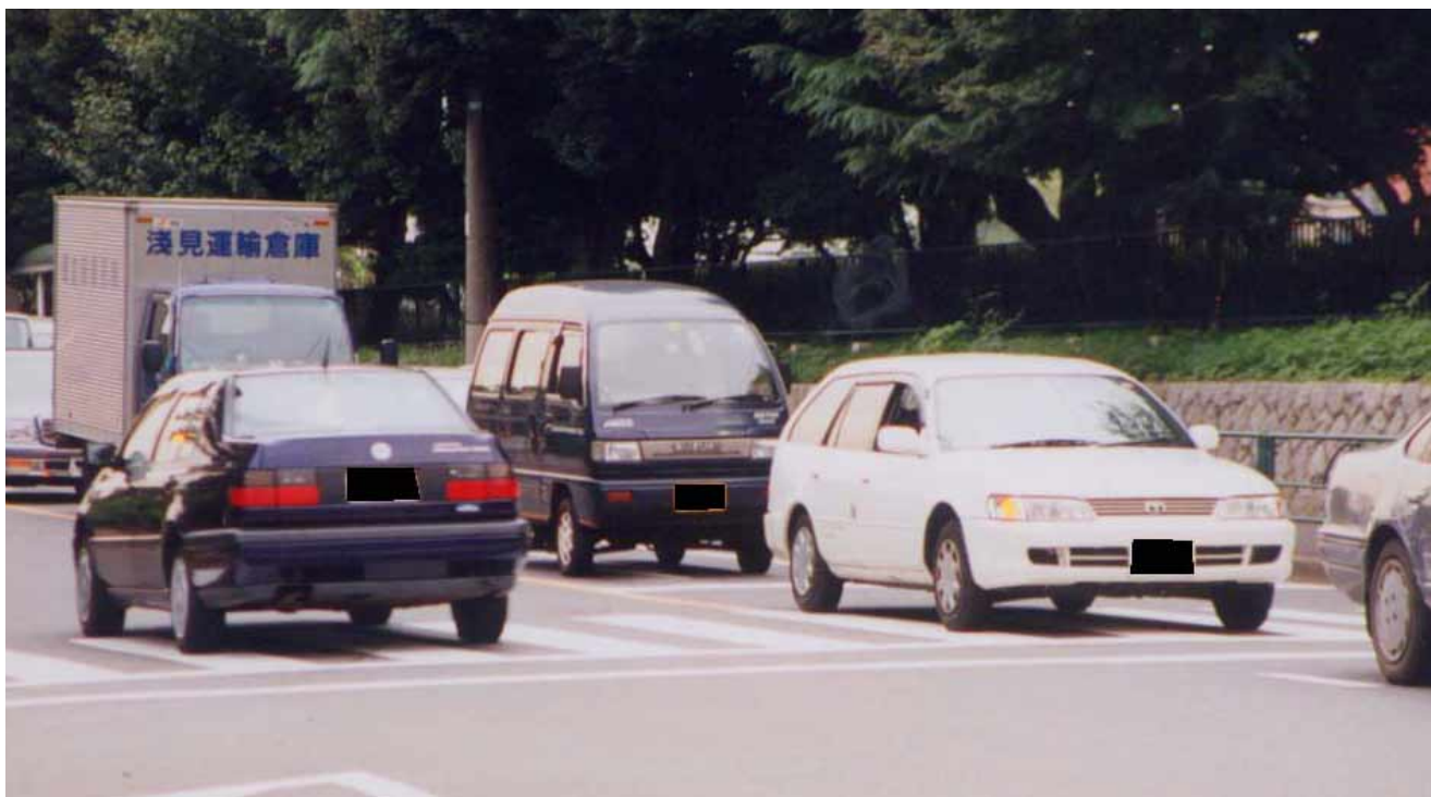
観察地点 / 東京都目黒区東が丘2丁目5 駒沢通りと自由通りが交差する「東京医療センター前」交差点付近 観察日 / 10月4日(木曜日) 天候 / 曇り 観察時間 / 15:40 - 16:40 観察者 / 4名