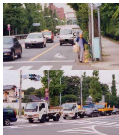
車道を歩く高齢者に迫るクルマ(上) / 車間距離をつめて交差点の右折レーンに進入するクルマの列(下)

変更する場合は3秒前に行なうことが必要だ。周囲への意志表示がしっかり行なわれないと追突の原因にもなりかねない。また、今回の観察で二輪車のウィンカーを点滅させるタイミングが遅いのが気になった。信号待ちのクルマの近くでウィンカーをつけても、クルマの死角となりかねず、ドライバーの発見が遅れることも、ウィンカーは早めに「点滅させて、相手に自分の意志を確実に伝えることが必要である。」