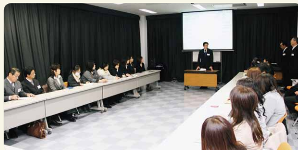
三重県鈴鹿市で開催された「東海・近畿・中国地区情報交換会」(鈴鹿普及ブロック)

今年3月には三重県、滋賀県、兵庫県、岡山県、8月には熊本県と宮崎県の指導者による情報交換会を開催しました。この情報交換会では、指導者に子どもや高齢者を対象にした指導の実演をしていただき、お互いが持っているノウハウを共有できるようにしています。参加者からは「自分の担当する地区以外の指導方法は、なかなか知ることができなかったので、良い機会になった」「定期的にこうした機会をつくってほしい」という声をいただいています。今後も、このような取り組みを他の地域でも展開していきたいと考えています。