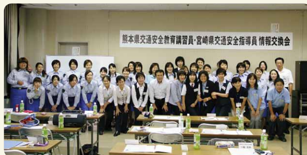
「熊本県交通安全教育講習員・宮崎県交通安全指導員情報交換会」(熊本普及ブロック)