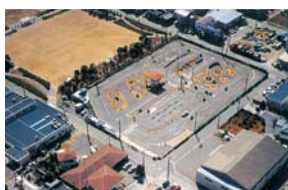
D 交通教育センター レインボー 浜松 (活動開始/1982年)

地域に密着した官庁・企業・団体の一般研修、指導者研修、一般向けスクールなど、さまざまな教育プログラムを用意。運転免許取得教習も行っている。