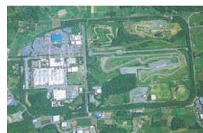
H 交通教育センター レインボー 熊本 (活動開始/1989年)

地域に密着した官庁・企業・団体の一般研修、一般向けスクールなど、さまざまな教育プログラムを用意。運転免許取得教習も行っている。