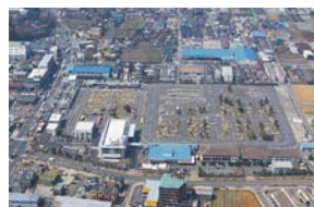
C 交通教育センター レインボー 和光 (活動開始/1997年)

直線600mのコースを活用した高速ブレーキ、危険回避等の訓練が可能。官庁・企業・団体をはじめ地域密着のさまざまなニーズに応える教育プログラムを用意。