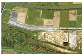
B 交通教育センター レインボー 埼玉 (活動開始/1980年)

日本初の「スリパリーコース」をはじめ、さまざまな危険を安全に体験できる先進施設を活用し、官庁・企業・団体や一般向けの各種教育プログラムを用意。