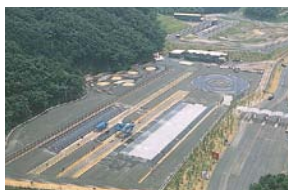
A アクティブセーフティ トレーニングパークもてぎ (活動開始/1997年)

日本初の「スリパリーコース」をはじめ、さまざまな危険を安全に体験できる先進施設を活用し、官庁・企業・団体や一般向けの各種教育プログラムを用意。