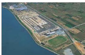
E 交通教育センター レインボー 浜名湖 (活動開始/2002年)

教育効果を上げるための独自の運転診断システムを取り入れた教育プログラムを用意。官庁・企業・団体の一般研修、指導者研修、一般向けスクールを開催。