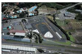
F 鈴鹿サーキット 交通教育センター (活動開始/1964年)

教育効果を上げるための独自の運転診断システムを取り入れた教育プログラムを用意。官庁・企業・団体の一般研修、指導者研修、一般向けスクールを開催。