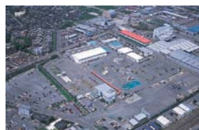
G 交通教育センター レインボー 福岡 (活動開始/1973年)

官庁・企業・団体の一般研修、指導者研修、一般スクールなどお客様ニーズに応え、鈴鹿サーキットレーシングコースを利用した教育プログラムもある。