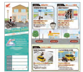
二輪販売会社で配布している「Pre-Riding Guide」