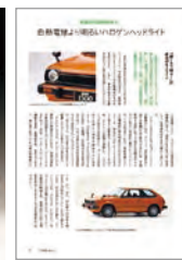
四輪販売会社で配布している「Think Safety」