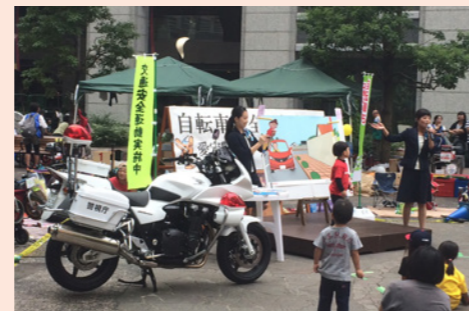
Honda Cars 東京中央が愛宕警察署と共同で開催した交通安全教室