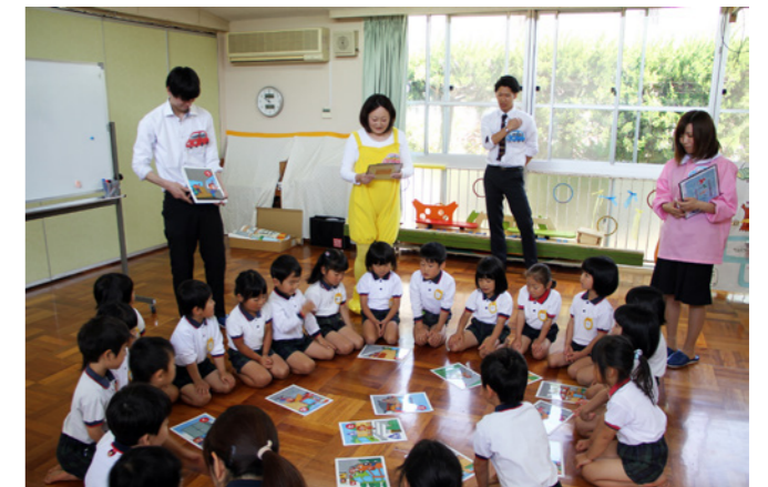
Honda Cars 駿河では「あやとりい」だけでなく、Honda 交通安全かるたも活用