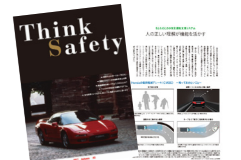
四輪販売会社を通じてお渡ししている安全運転情報誌「Think Safety」