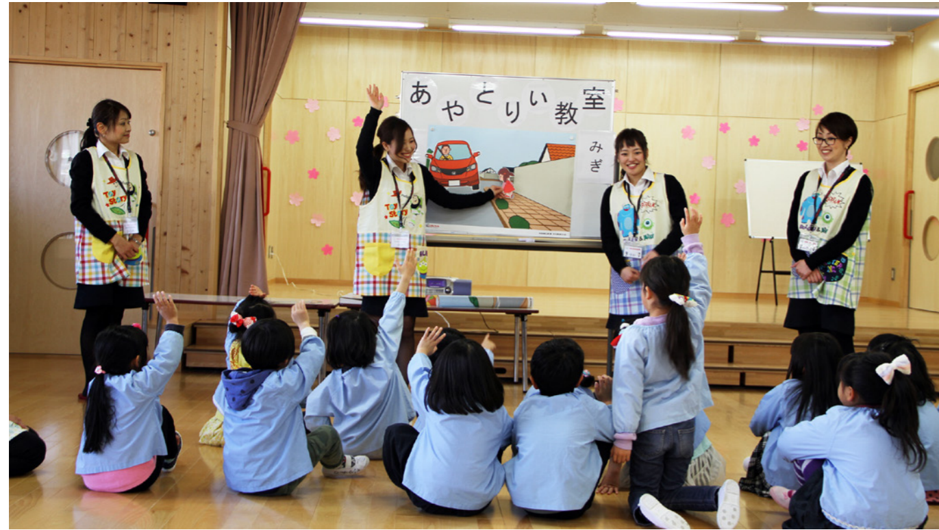
Honda Cars 群馬のスタッフがまついだ保育園（群馬県安中市）で開催した交通安全教室

Honda は地域社会に交通安全の輪を広げるため、販売会社を通じた交通安全活動を行っています。販売会社では、店頭での安全アドバイスなど、お客様との触れ合いを大切にした手渡しの安全活動を実践しています。