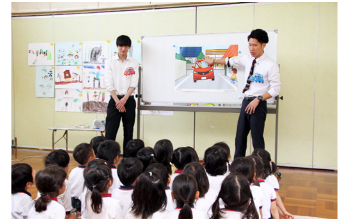
Honda Cars 駿河のスタッフが西方保育園（静岡県菊川市）で開催した交通安全教室