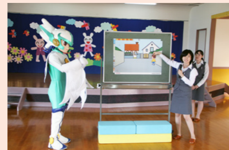
Honda Cars 山陰中央のスタッフと J リーグ加盟のサッカークラブ「ガイナーレ鳥取」のマスコットキャラクターと一緒に指導