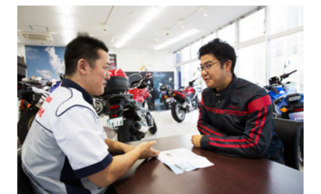
二輪販売会社では啓発ステッカーをお渡しするとともに交通安全のお声掛けを実施

その中で二輪・四輪販売会社の店頭ではお客様に安全運転を意識していただくため、全席シートベルトの着用、ヘルメットのご紐の締め付けや日常点検実施のお声掛けをしたり、啓発冊子をお渡しするなどの活動を行なっています。また、今年は四輪販売会社を通じ、お客様に安全を手渡すためのツールとして安全運転情報誌「Think Safety」を創刊しました。Honda の安全技術への理解を高めるとともに、交通安全に関する社会の動向と合わせ、安全運転のためのアドバイスを紹介しています。