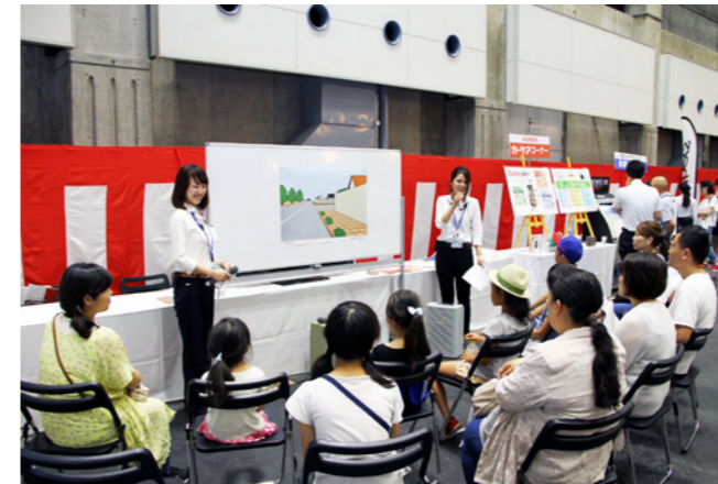
Honda Cars 岡山は7月に開催した同社のイベントの中で、来場した親子を対象に交通安全教室を開催