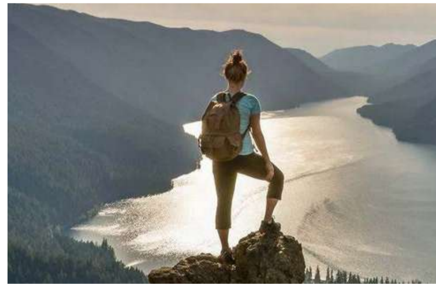
新しい発見をしに行きたい