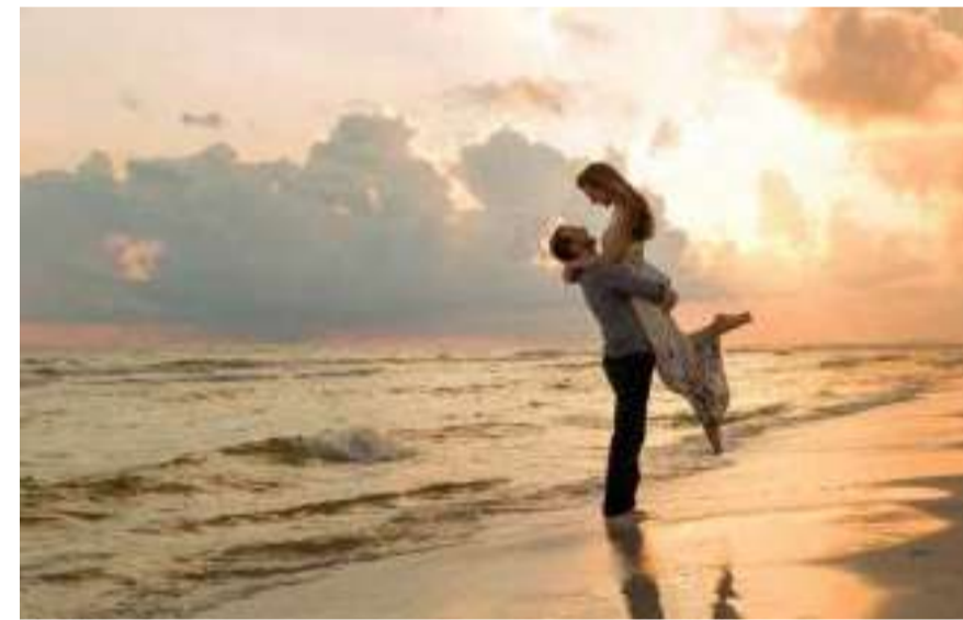
愛する人に逢いに行きたい