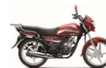
CD110 Dream(インド) 2020年6月発売

【ホンダ】 インドやインドネシアを中心に前年度を下回る ベトナムやタイでは足元で前年度並みに回復 中国や米国で前年度を上回る 魅力ある商品の投入を軸にシェア拡大を目指す