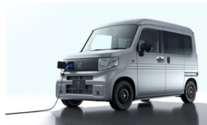
N-VAN e:（日本） 2024年10月発売予定