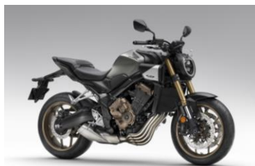
CB650R E-Clutch（グローバル） 2024年1月 欧州より順次発売