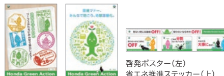
啓発ポスター(左) 省エネ推進ステッカー(上)

「Honda Green Action」ではさまざまなツールを活用し、従業員へ身近な環境活動への意識づけをしています。毎年6月の環境月間に合わせて、啓発ポスターや省エネ推進ステッカーを配布しています。