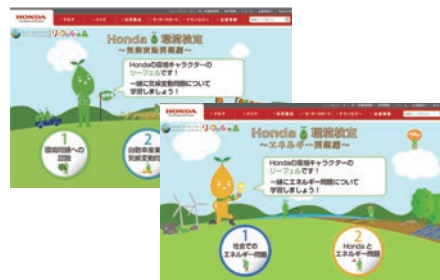
Honda環境検定 気候変動問題編(左)と、エネルギー問題編(右)

環境マネジメントシステムに基づいた研修型教育に加え、実践型教育の一環として環境eラーニングを実施しています。これは「Honda環境検定」と名付けられ、「Honda Green Action」が掲げる取り組みを中心に、環境問題の一般的知識や世界の動向などをクイズ形式で出題して解答を解説するもの。社内イントラネットおよびウェブサイトで公開しており、役職、専門性を越えた受講ができるため、従業員全体の環境意識向上に寄与しています。2014年にはスマートフォンやタブレット端末にも対応し、英語版をグローバルウェブサイトで公開しています。