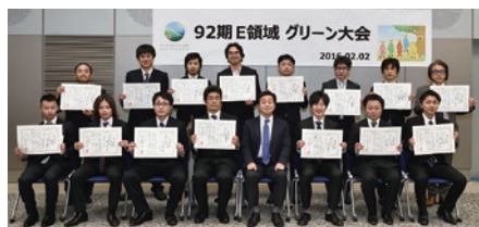
E領域(生産領域)の発表者全員での集合写真

2015年度は、2016年度に開催される本選大会に向けた3年間の2年目に当たり、各事業所のアイデアあふれる多彩な環境取り組みがそれぞれの領域大会で発表されました。