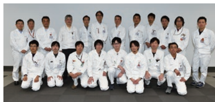
(株)本田技術研究所(商品開発領域)の発表者全員での集合写真