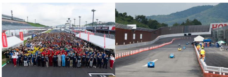
第42回 全国大会 大会風景 (モビリティリゾートもてぎにて)