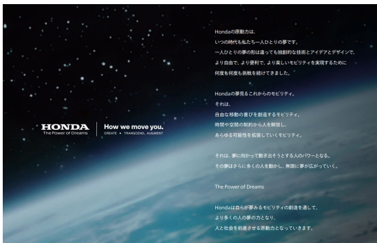
グローバルブランドスローガン

URL: https://global.honda/jp/sustainability/integratedreport/