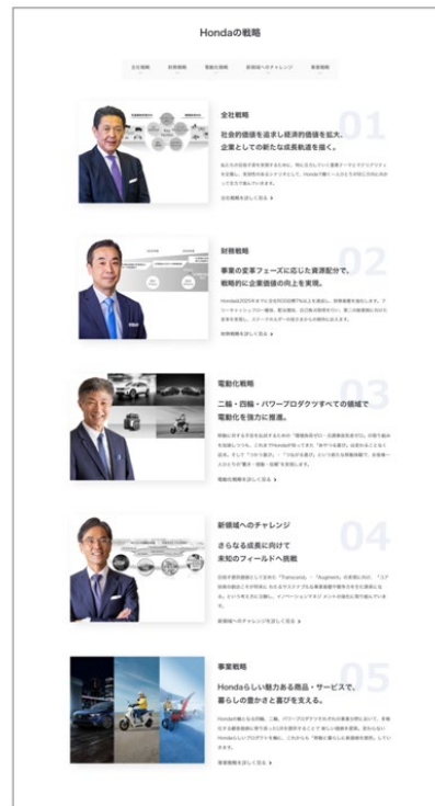
WEB ページ (HTML) イメージ