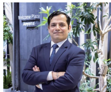
従業員インタビュー