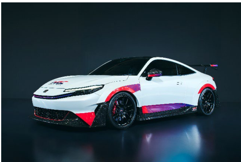
PRELUDE HRC Concept