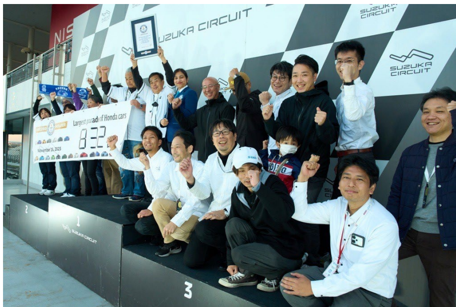
当日のパレード参加者