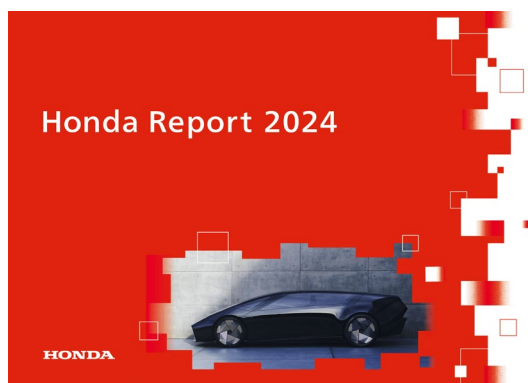
Honda Report 2024

URL: https://global.honda/jp/sustainability/integratedreport/