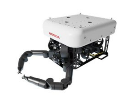
作業用 ROV コンセプトモデル

洋上風力発電のメンテナンスなど、水中作業を行う遠隔操作型の無人潜水機。操縦者のマニピュレーター操作に合わせて、ROVが自動で移動・旋回するHonda独自の「マニピュレーター・ROV協調制御」や、浮心と重心のずれを自動で制御することでROV本体の姿勢を保つ「浮心・重心制御機構」、水流から受ける力を軽減する「流体抵抗低減ボディー形状」により、操縦者は水流などの外乱に影響を受けず、ROVを利用した高度な作業が可能です。