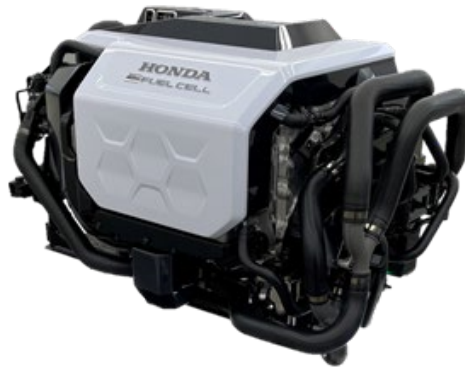
Honda 燃料電池モジュール プロトタイプ

GM との共同開発による燃料電池システムをベースとした、最大出力 80kW を有する外販用モジュールです。このモジュールに組み込まれる燃料電池システムは、FCEV「CLARITY FUEL CELL（クラリティ フューエル セル）」〈2019 年モデル〉に搭載していた燃料電池システムに対して、コストを 3 分の 1、耐久性を 2 倍に向上させるとともに、耐低温性も大幅に向上させています。H2&FC EXPO では、Honda の燃料電池の仕組みを動画でわかりやすく紹介します。