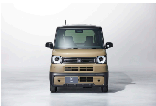
N-BOX JOY エクステリア

N-BOX 製品サイト https://www.honda.co.jp/Nbox/