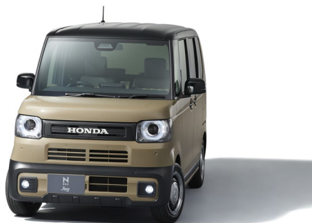
N-BOX JOY エクステリア アクティブフェイスパッケージ装着車

2023年に発売された3代目 N-BOX/N-BOX CUSTOM は、質感の高いデザインや広い室内空間に加え、開放感のあるすっきりとした視界が生み出す、運転がしやすく居心地の良い空間が幅広い層のお客様にご好評をいただいています。