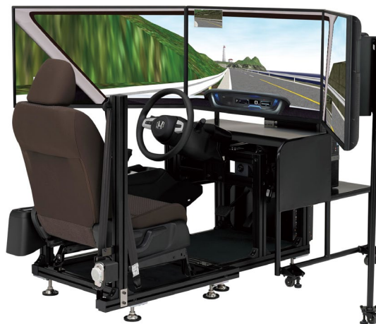
Honda ドライビングシミュレーター「DB 型 Model-A」

Honda は、運転復帰を目指すリハビリテーション加療中の方の運転能力の評価をサポートする医療機関向けの本格ドライビングシミュレーター「DB 型 Model-A」を、本日発売しました。